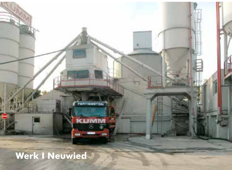
Werk I Neuwied