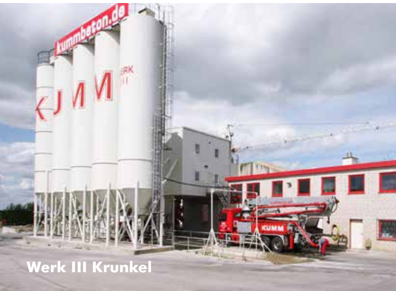
Werk III Kunkel