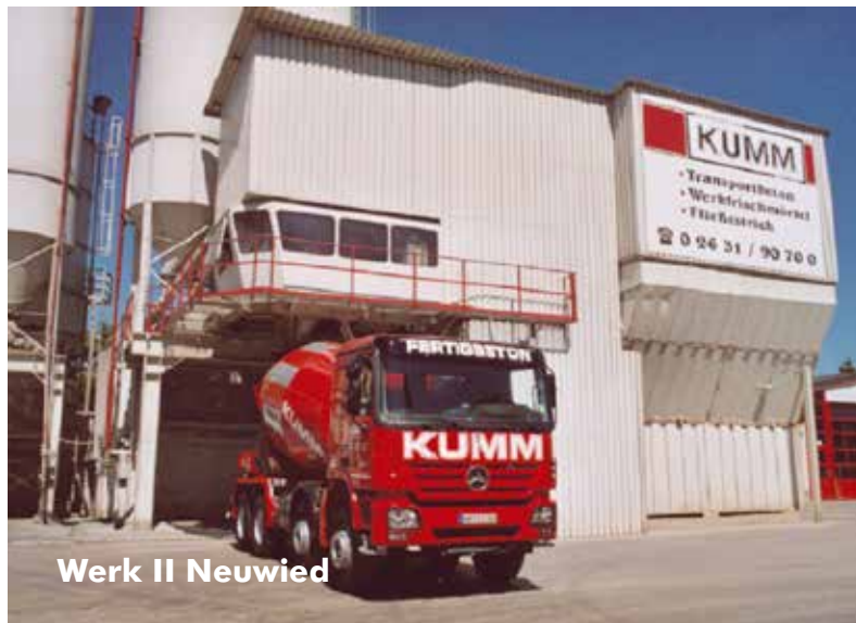
Werk II Neuwied